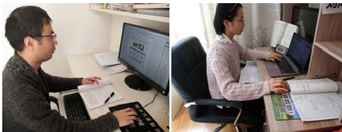
老师线上用手机电脑教学

在线课堂教学如火如荼，老师们在各大教学平台化身成为“直播高手”“网课达人”倾心打造精彩课堂，有效保证了在线学习与线下课堂教学质量实质等效。停课不停学，重学更重心，为了能够在线教学，货运教研室的老师克服了各种困难，为了战疫从三尺讲台迈向了十八线主播行列。