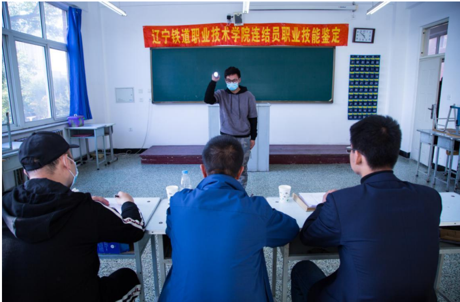
连结员夜间手信号