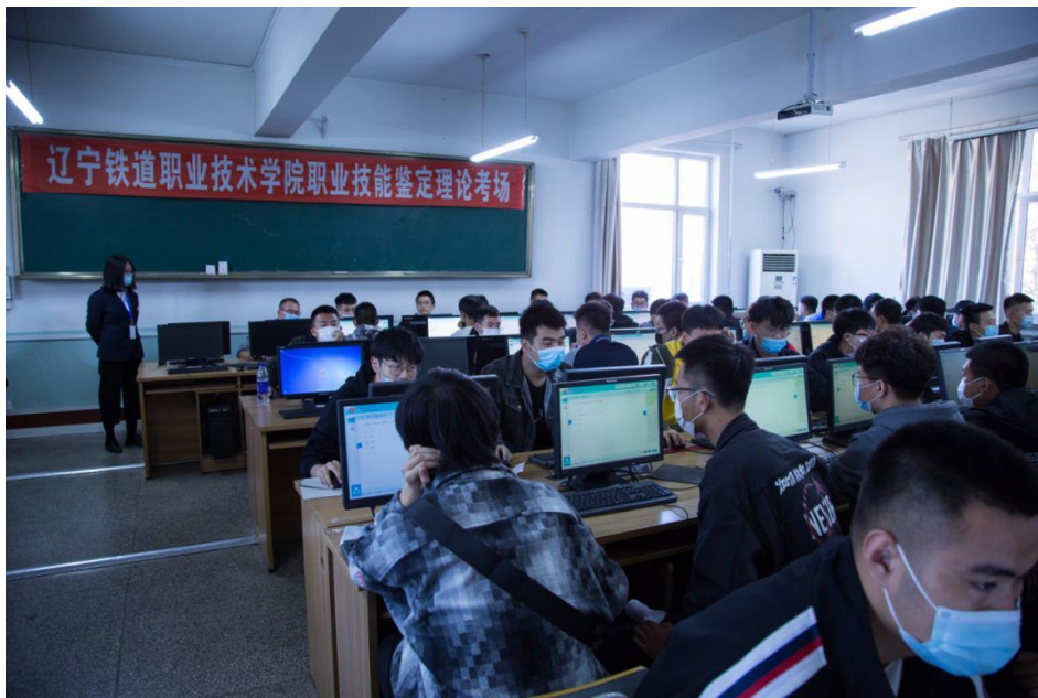
技能鉴定理论考试

学校为了保证技能鉴定总体质量，鉴定前，要求各学院严格按照学校整体教学安排，展开为期一周的理实一体系统训练和培训工作，并要求每个学院针对技能鉴定实践内容，开展了职业技能竞赛周，全面提升学生实作技能，为取得职业技能鉴定证书奠定良好的基础。